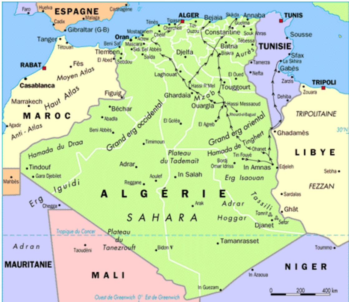
Carte de l'Algérie actuelle

En 1830, les français débarquent avec une flotte de cinq cents navires sur la presqu'île de Sidi Ferruch ; la colonisation de l'Algérie débute et avec elle une Histoire commune qui influencera durablement les deux peuples jusqu'à nos jours. Une relation particulière perdue aujourd'hui encore entre la France et l'Algérie, faite de passions, d'engagements, d'espoirs souvent déraisonnables, et de déceptions, sur fond d'Histoire coloniale mal assumée.